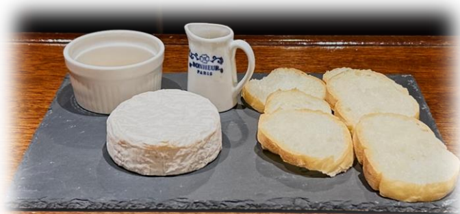
カマンベールチーズのホールロースト Whole Roasted Camembert Cheese