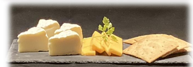
カマンベール&レッドチェダー Cheese Board