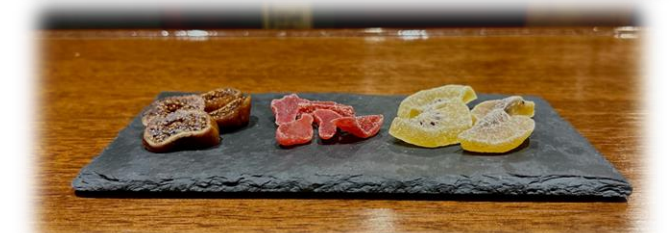
ドライフルーツ 3種盛 Dried Fruits