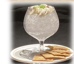
レーズンバター Raisin & Butter