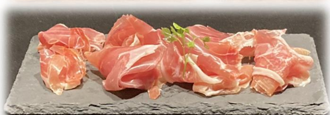
生ハム (ハモンセラーノ) Prosciutto