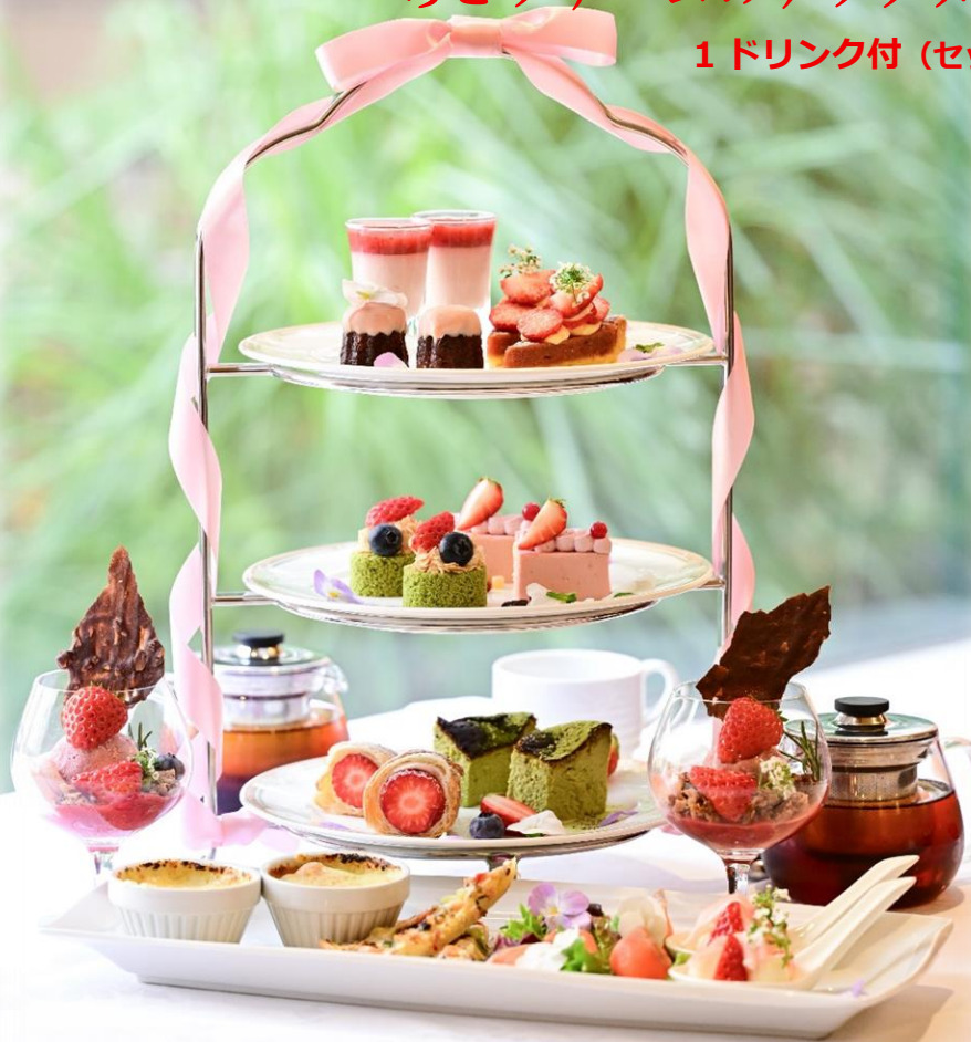
写真は2名様分になります